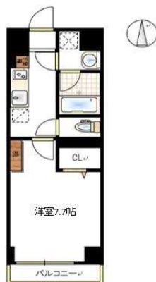
※概略図に付き、現状を優先します。