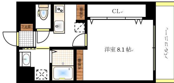
※概略図に付き、現状を優先します。