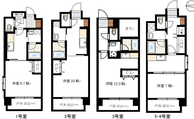
1号室 2号室 3号室 5・6号室