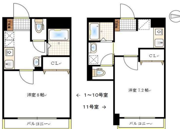
※概略図に付き、現状を優先します。 ※反転タイプ有